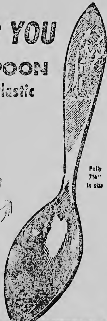
Fully 7 1/4" In size

NO EXTRA COST! Ask for the large Scott's Emulsion package containing a beautiful tablespoon. Obtainable in six attractive colors. Then give your family this scientific, vitamin-rich food- tonic every day, as many doctors recommend. You'll soon have a stronger and healthier family.